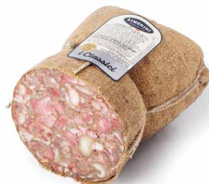
Soppressata in juta