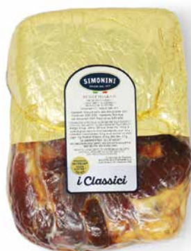
Crudo stagionato dissosato Dolce Sella