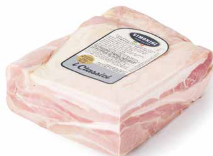
Pancetta affumicata cotta