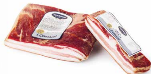
Pancetta tesa affumicata