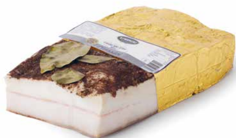
Lardo alle erbe