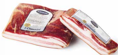
Pancetta tesa dolce